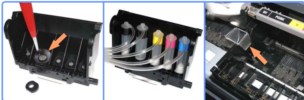
Подготовка печатающей головки iP4300

Если у Вас возникли трудности с установкой пигментной капсулы, подержите её немного в горячей воде (нижний край). После этого она легко оденется на штуцер.