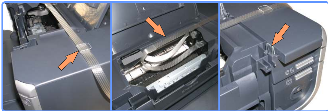
Прокладка шлейфа iP4300