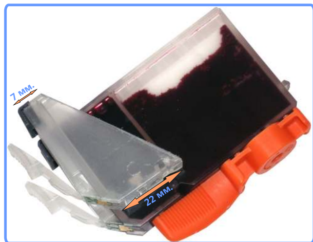
Модификация картриджей iP4300

Возьмите пустой картридж, отмойте его от оставшихся чернил. И при помощи специального инструмента, входящего в набор, или ножовки, отпилите часть картриджа, как показано на фотографии.