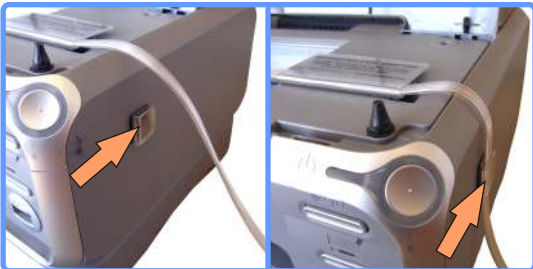
Вывод шлейфа iP3000

Спустите шлейф от основной клипсы вниз и закрепите его, в клипсе держателе.