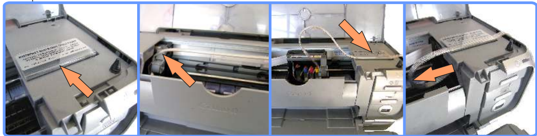
Прокладка шлейфа iP3000

Отрегулируйте длину шлейфа таким образом, чтобы в крайних левом и правом положении шлейф нигде не пережимался и не натягивался. Это можно легко сделать слегка разжимая клипсу-держатель и передвигая шлейф.