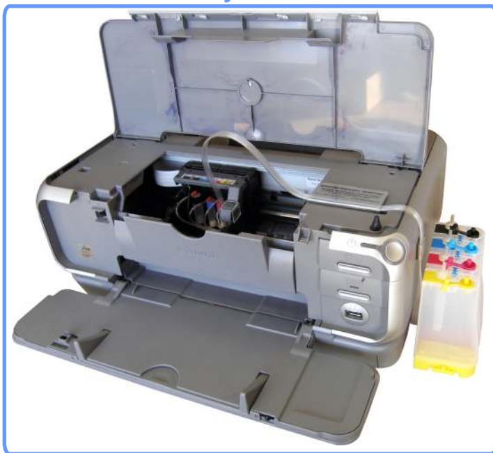
Система установлена iP3000