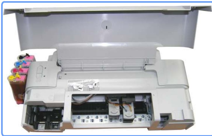
Установленная система iP1200