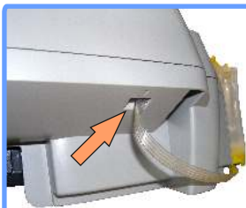
Вывод шлейфа iP1200

Если Вы устанавливаете систему не на новые картриджи, а уже на частично израсходованные, имеет смысл перед установкой дозаправить картриджи. Для этого наберите в шприц чернил нужного цвета и, воткнув иглу в соответствующее отверстие, заполните картридж. Не путайте цвета!