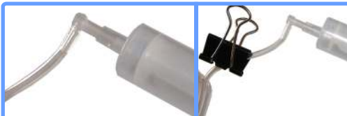
Заправка системы iP1200