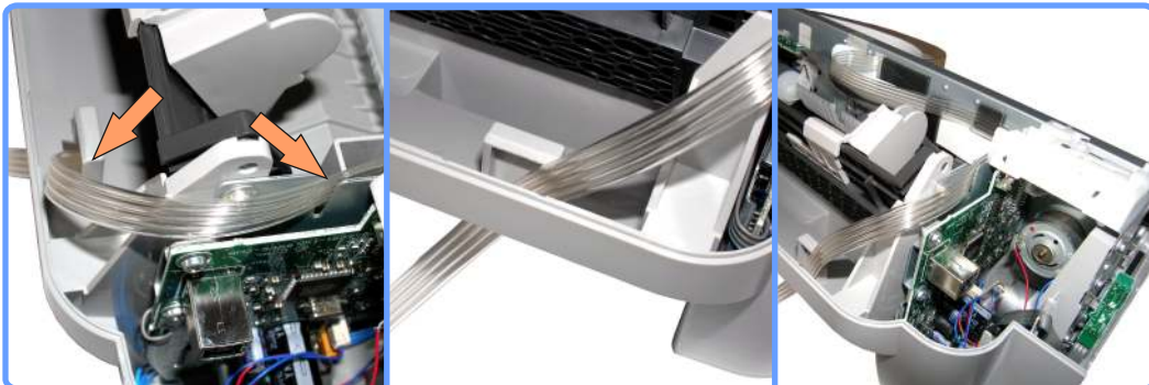
Укладка шлейфа iP1200

Проденьте шлейф сзади через отверстие у правой защёлки и проложите как показано на фотографиях.