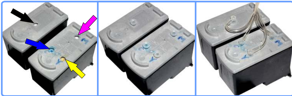
Модернизация картриджей iP1200

Не путайте цвета! На картридже маркером обозначен цвет отсека С-М-У (Синий, Красный, Жёлтый).