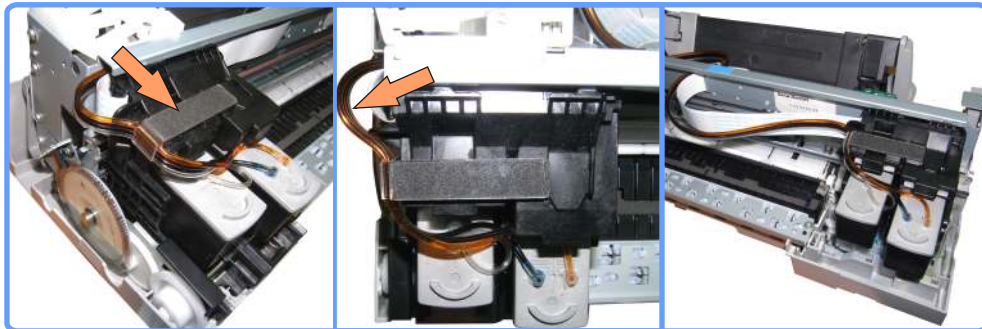
Установка картриджей iP1200

Приклейте клипсу на картку, над местом чёрного картриджа. Установите картриджи на место, проложив шлейф в клипсу. Отрегулируйте длину шлейфа, таким образом, чтобы он нигде не перетягивался и не провисал. Слева шлейф не должен быть натянут, он должен идти дугой, как показано на фото.