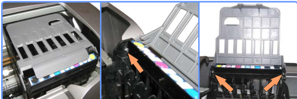
Снятие крышки картриджного отсека SP950

Снимите крышку картриджного отсека, откинув её так чтобы ключи на её держателях, совпали с отверстиями на корпусе каретки и разжав их в стороны.