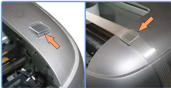
Вывод шлейфа SP950

Установите клипсу с правой стороны принтера.