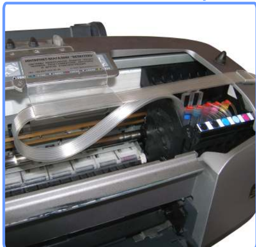
Завершение установки SP950

Отрегулируйте шлейф таким образом, чтобы в крайних левом и правом положениях каретки шлейф излишне не натягивался и не провисал. Шлейф можно двигать, слегка разжимая держатель полочки.