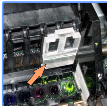
Установка альтернативной планки 2100

Возможно, в комплекте системы будет не белая, а прозрачная планка. Установите её, как показано на фото.