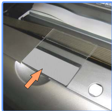
Установка полочки-подвеса 2100

Проложите в полочку-подвеса шлейф и закрепите её, как показано на фото.