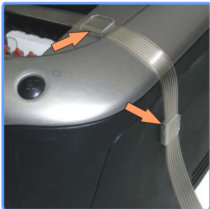
Вывод шлейфа 2100

Установите две клипсы с правой стороны аппарата. Выведите шлейф через только что установленные клипсы.