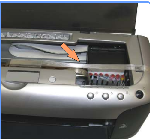
Прокладка шлейфа 2100