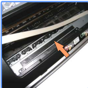
Прокладка шлейфа SP1410

Отведите печатающую головку в крайнее правое положение, и пропустив шлейф под кареткой приклейте его двусторонним скотчем на шасси принтера. Не натягивайте сильно шлейф, он должен образовать петлю. Но и не отпускайте слишком сильно, шлейф не должен мешать движению печатающей головки.