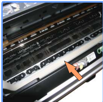
Прокладка шлейфа SP1410