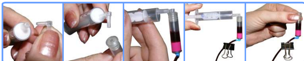
Заправка капсул и шлейфа SP1410

Отстыкуйте капсулу от шприца и наденьте капсулу на соответствующий чернильный штуцер печатающей головки принтера. После этого можно освободить зажим.