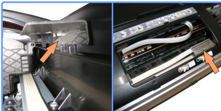
Установка фиксатора шлейфа SP1410

Установите фиксатор шлейфа на переднюю панель с тыльной стороны. Чуть левее картриджного отсека.