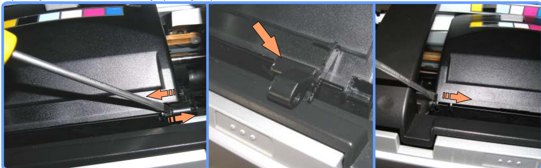
Снятие крышки картриджного отсека SP1410

Снимите фиксатор крышки картриджного отсека, аккуратно отжав его вправо, одновременно отжимая крышку влево. И снимите саму крышку вправо.