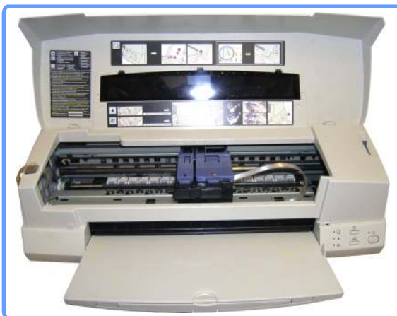
Установленная система EPSON Stylus Photo 1200