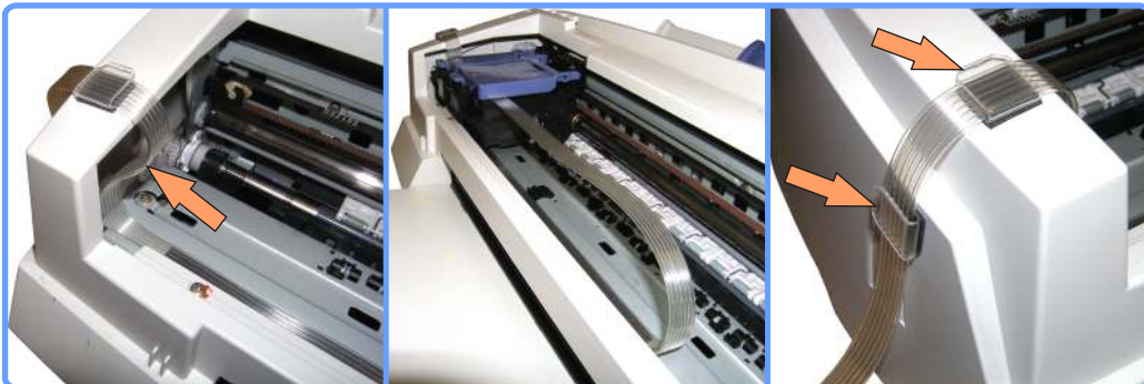
Прокладка шлейфа SP1200

Закрепите две клипсы на левой стороне принтера. Проденьте в них шлейф, как показано на фотографии. Проверьте, чтобы образовавшийся изгиб не мешал движению каретки, и подрегулируйте длину шлейфа.