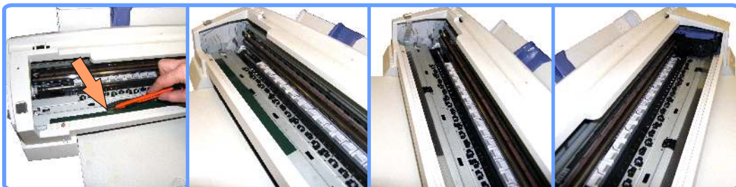
Прокладка шлейфа SP1200

Пропустите шлейф под кареткой и, загнав каретку в крайнее правое положение, приклейте его на скотч. Шлейф не должен излишне натягиваться или наоборот мешать движению каретки.