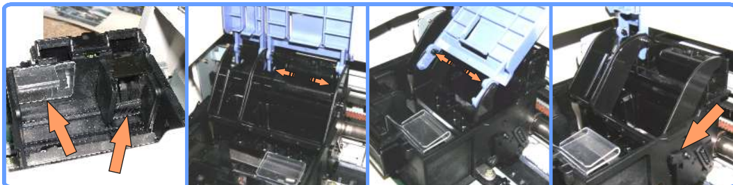
Установка клипс-фиксаторов и удаление фиксаторов картриджей SP1200

Снимите фиксаторы картриджей. Для этого откройте крышку (синюю), разожмите в стороны крепления и снимите её. Наклонив крышку назад, чтобы ключ фиксатора совпал с вырезом на её креплении, разожмите фиксатор и снимите с него крышку. Приподняв фиксатор и повернув его так, чтобы ключ сбоку совпал с вырезом в каретке, снимите его. Снимите второй фиксатор. Установите крышки обратно.