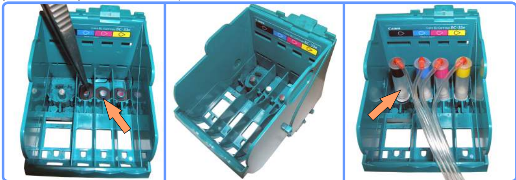
Установка капсул S400

Удалите уплотнительные резиновые прокладки в каждой секции каретки печатающей головки принтера и установите капсулы, как показано на фото.