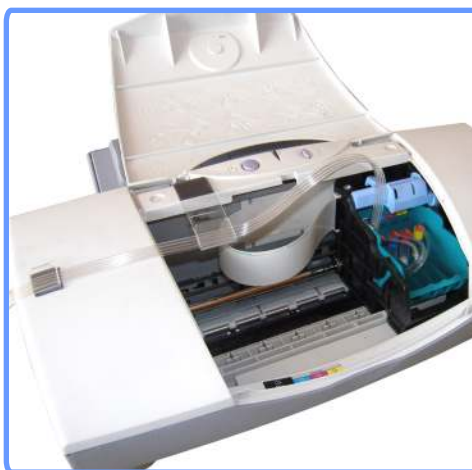
Система установлена S400