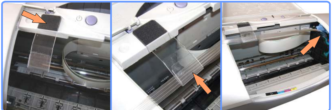
Прокладка шлейфа S400

Установите полочку подвеса, как показано на фото. Уложите в неё шлейф, переместив каретку вправо.