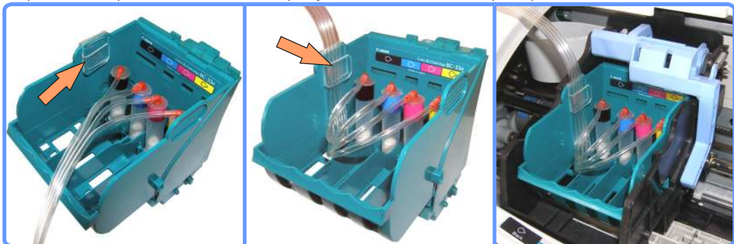
Прокладка шлейфа в каретке S400

Закрепите клипсу-держатель шлейфа на левой стенке каретки. Аккуратно уложите капилляры и закрепите шлейф в клипсе. Установите каретку на её штатное место в принтере.