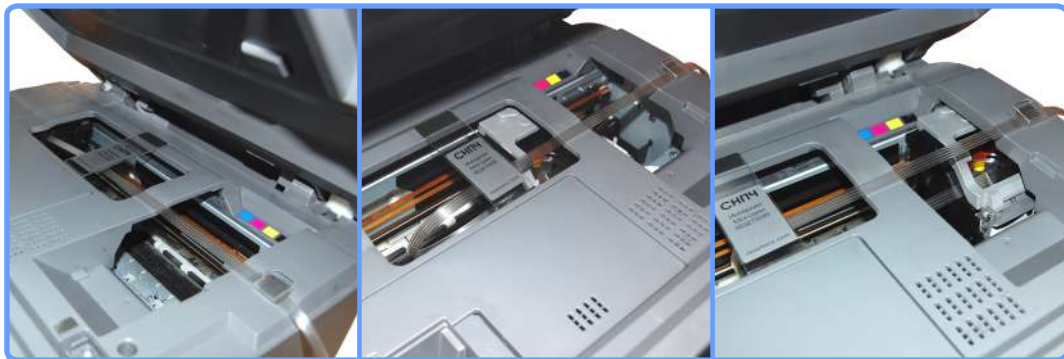
Укладка шлейфа RX520

Шлейф нигде не должен заминаться, пережиматься, цепляться, сильно натягиваться или тормозить каретку.