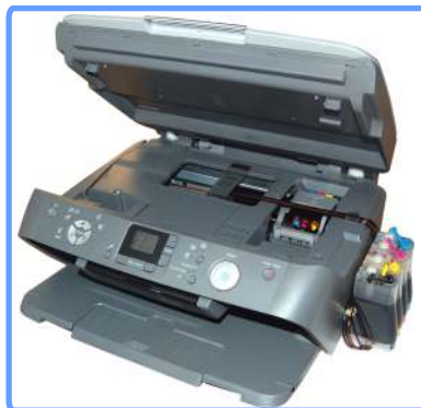
Установленная система RX520