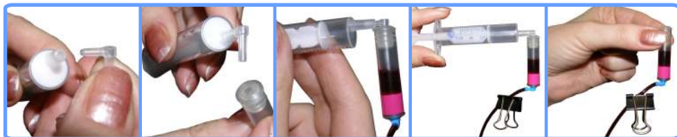
Заправка капсул и шлейфа RX520

Отстыкуйте капсулу от шприца и наденьте капсулу на соответствующий чернильный штуцер печатающей головки принтера. После этого можно освободить зажим.