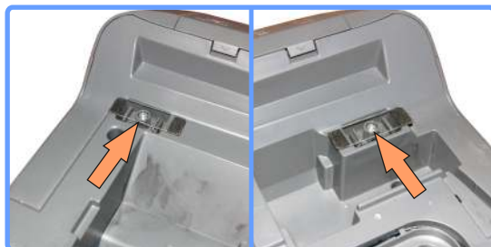
Фиксация крышки RX520

Приклейте два фиксатора по углам принтера, сразу за передней панелью. Фиксаторы будут мешать крышке принтера, закрыться полностью предотвращая пережим шлейфа.