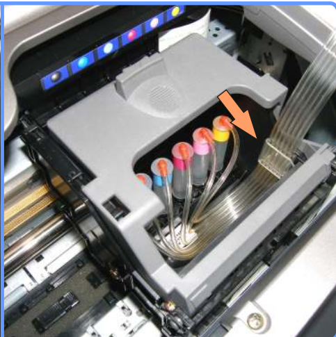
Установка капсул и планки с чипами R300