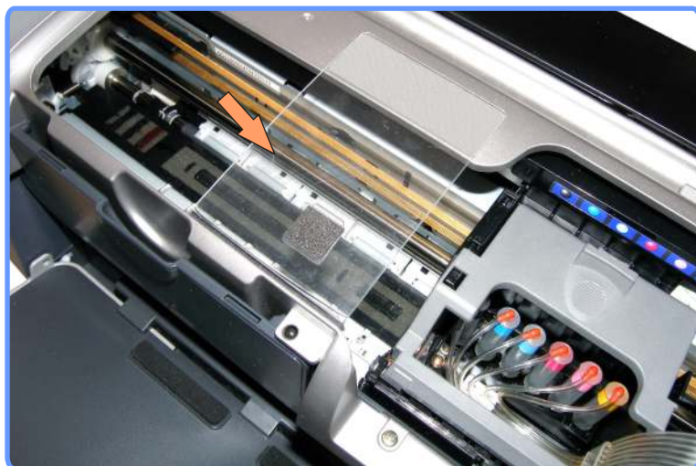
Установка полочки-подвеса R300

Закрепите полочку подвеса шлейфа, как показано на фото.