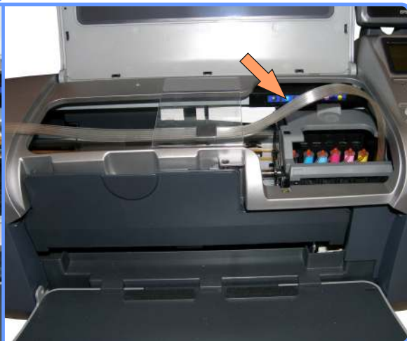
Прокладка шлейфа R300