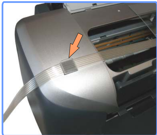
Вывод шлейфа R300

Установите клипсу с левой стороны аппарата. Закрепите шлейф в полочке подвеса, выведя его через только что установленную клипсу.