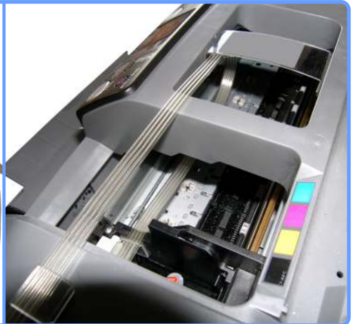
Прокладка шлейфа R240