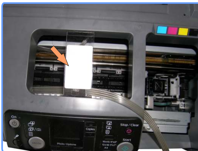
Установка полочки-подвеса R240

Закрепите полочку подвеса шлейфа, как показано на фото.