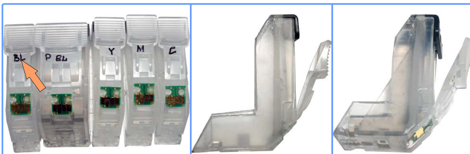
Модификация картриджей MP600

На чёрном картридже нужно сделать дополнительный вырез. На пигментном чёрном такой же но только с одной стороны. Эти вырезы нужны для полочки крепления шлейфа, она будет мешать вставить картридж без выреза. Установите модифицированные картриджи на их штатные места в каретке.