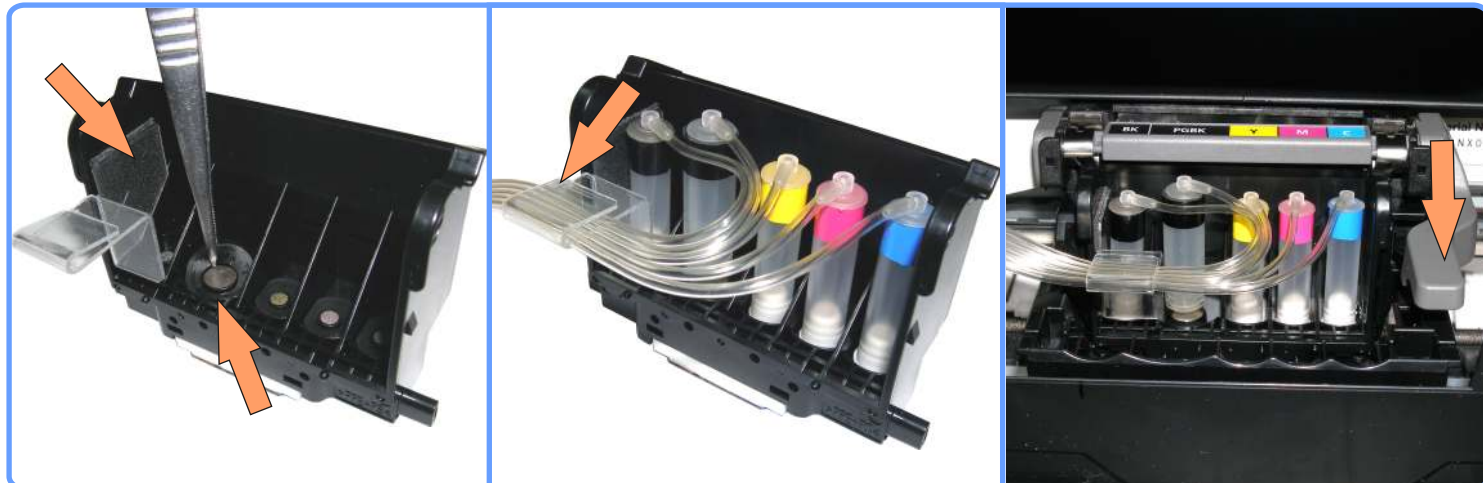
Подготовка печатающей головки MP600

Если Вы испытываете трудности с установкой пигментной капсулы, подержите её немного в горячей воде, нижним краем. После чего она легко оденется на штуцер.