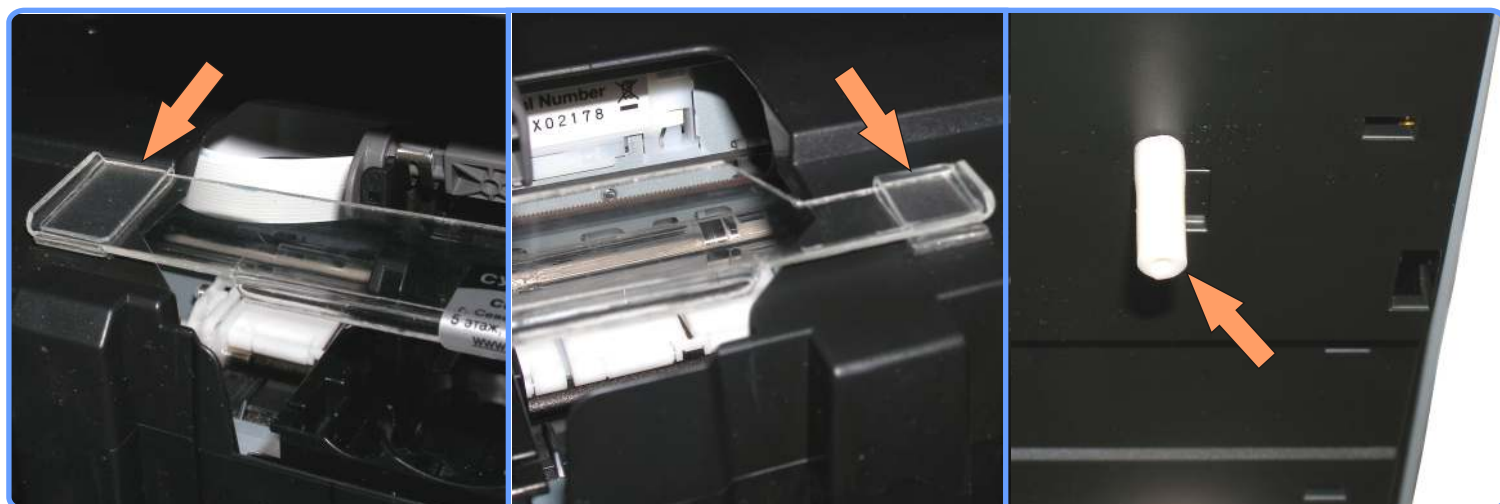
Прокладка шлейфа MP600

Закрепите специальный удлинитель, на датчике закрытия крышки. Датчик находится справа под крышкой.