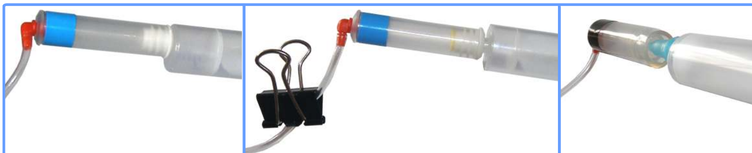
Заправка системы MP600

Заполните все капсулы соответствующими цветами чернил на половину, для чего наденьте по очереди капсулы на шприц и вытягивайте воздух поршнем до тех пор, пока шлейф и капсула не заполнятся чернилами. После чего пережмите шлейф биндером и, сняв капсулу со шприца, установите её в каретку принтера на положенное место. Для пигментной капсулы используйте переходник для шприца.