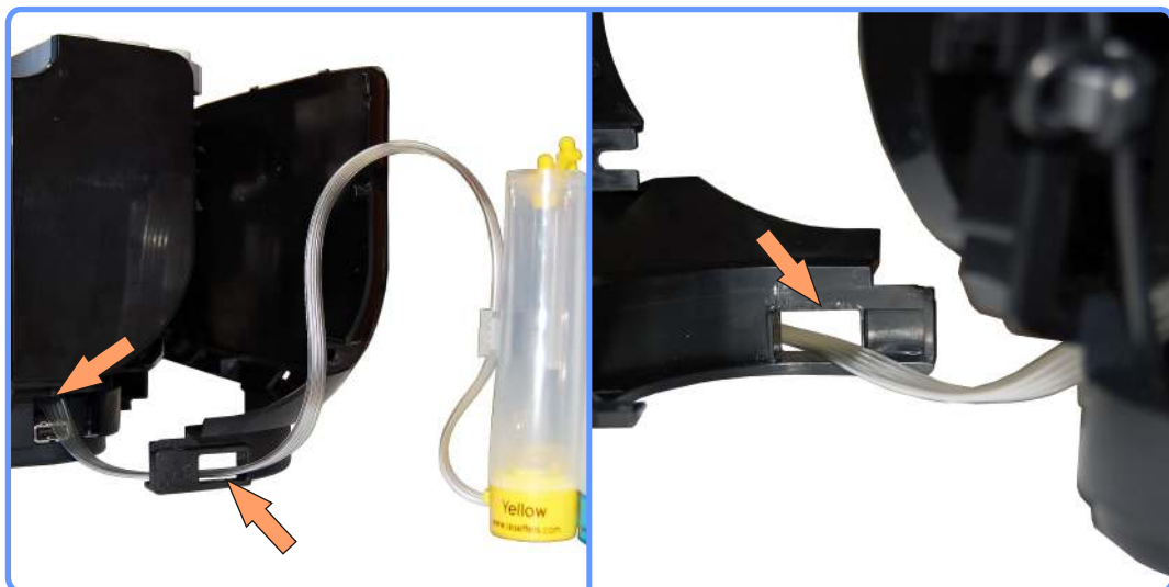
Вывод шлейфа MP210

Для вывода шлейфа необходимо немного подрезать верхнюю направляющую гнезда USB. Обратите внимание, не надо расширять отверстие, а только срезать верхний "козырёк", который находится прямо над гнездом USB.