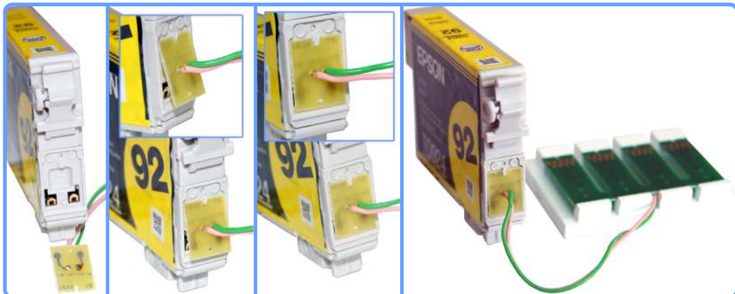
Подключение контактной площадки

Возьмите контактную площадку и поставьте её на место оригинального чипа. Если будет плохо держаться, приклейте клеем.