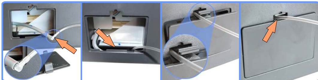
Удлинение капилляра стока CX7300

Уложите место соединения, как показано на фото, и установив на место крышку, выведите капилляр через щель в защёлке.