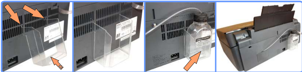
Установка держателя стока CX7300

Так Вы сможете визуально контролировать наполнение ёмкости отработанными чернилами и при наполнении ёмкости легко опустошать её.