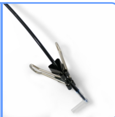
Заправка системы для HP DeskJet F4283