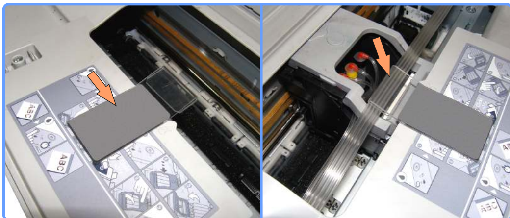
Прокладка шлейфа CX3500

Закрепите полочку подвеса шлейфа, как показано на фото. Проложите через ней шлейф.