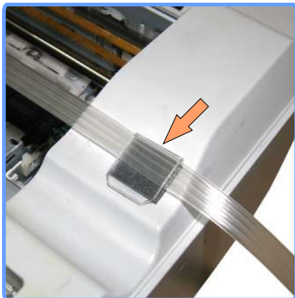
Вывод шлейфа CX3500

Установите клипсу с правой стороны аппарата. И выведите через неё шлейф.