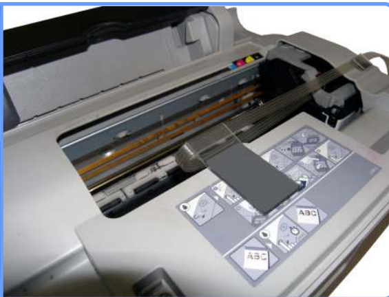
Прокладка шлейфа CX3500