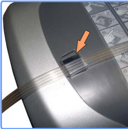
Вывод шлейфа C86

Установите клипсу с левой стороны аппарата и выведите через неё шлейф.