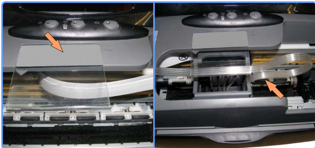
Установка полочки-подвеса С86

Закрепите полочку подвеса шлейфа, как показано на фото и разместите в ней шлейф.