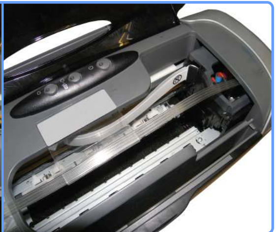
Прокладка шлейфа C86