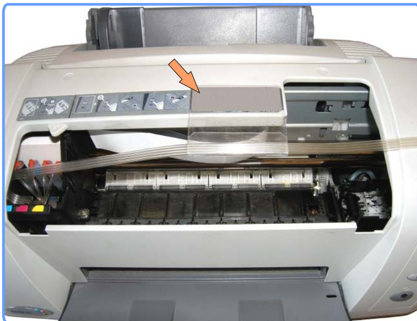
Установка полочки-подвеса С82

Закрепите полочку подвеса шлейфа и проложите через ней шлейф, как показано на фото.