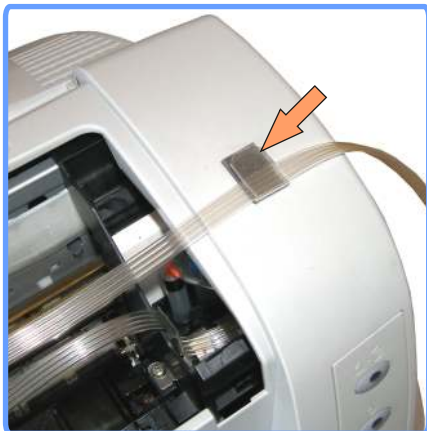
Вывод шлейфа С82

Установите клипсу с левой стороны аппарата. И выведите через неё шлейф.