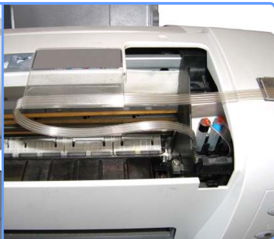
Прокладка шлейфа С82