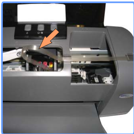
Прокладка шлейфа С67

Отрегулируйте шлейф таким образом, чтобы в крайних левом и правом положениях каретки шлейф излишне не натягивался и не провисал. Шлейф можно двигать, слегка разжимая держатель полочки.