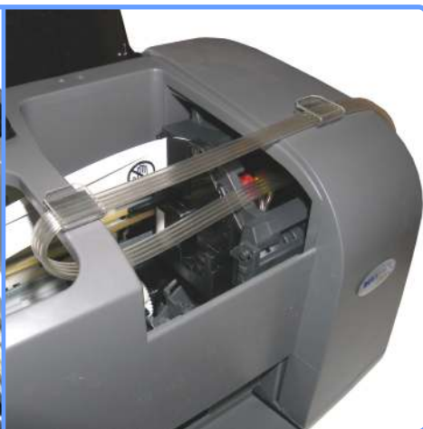
Прокладка шлейфа С67