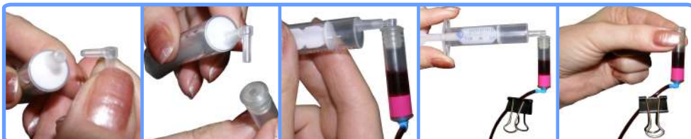
Заправка капсул и шлейфа С67

Отстыкуйте капсулу от шприца и наденьте капсулу на соответствующий чернильный штуцер печатающей головки принтера. После этого можно освободить зажим.