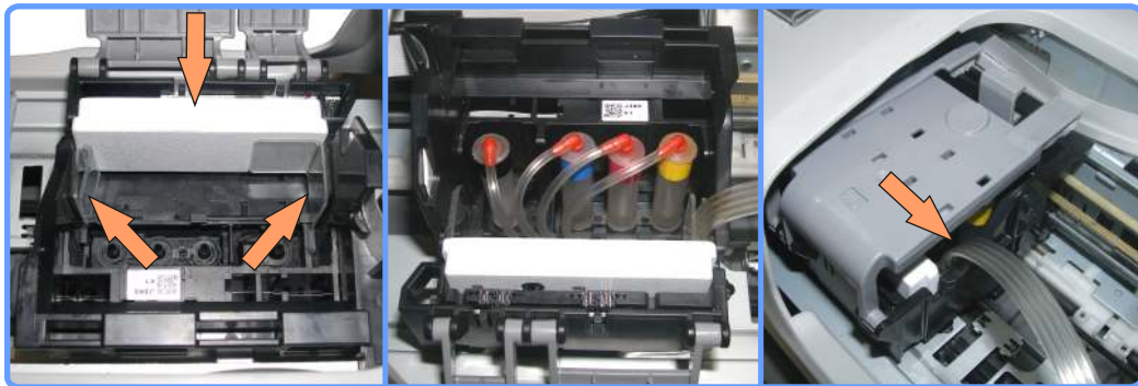
Установка капсул и планки с чипами C45

Закройте крышку картриджного отсека, пропустив шлейф справа.