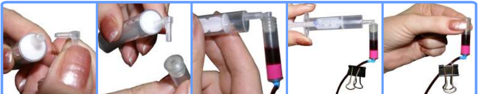
Заправка капсул и шлейфа C45

Отстыкуйте капсулу от шприца и наденьте капсулу на соответствующий чернильный штуцер печатающей головки принтера. После этого можно освободить зажим.