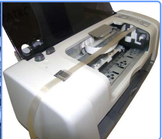
Прокладка шлейфа C45