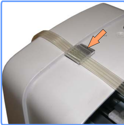
Вывод шлейфа C45

Установите клипсу с левой стороны аппарата, и выведите через неё шлейф.