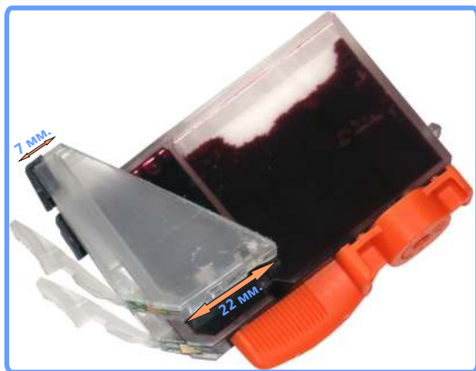
Модификация картриджей iP6700D

Возьмите пустой картридж, отмойте его от оставшихся чернил. И при помощи специального инструмента, входящего в набор или ножовки, отпилите часть картриджа как показано на фотографии.