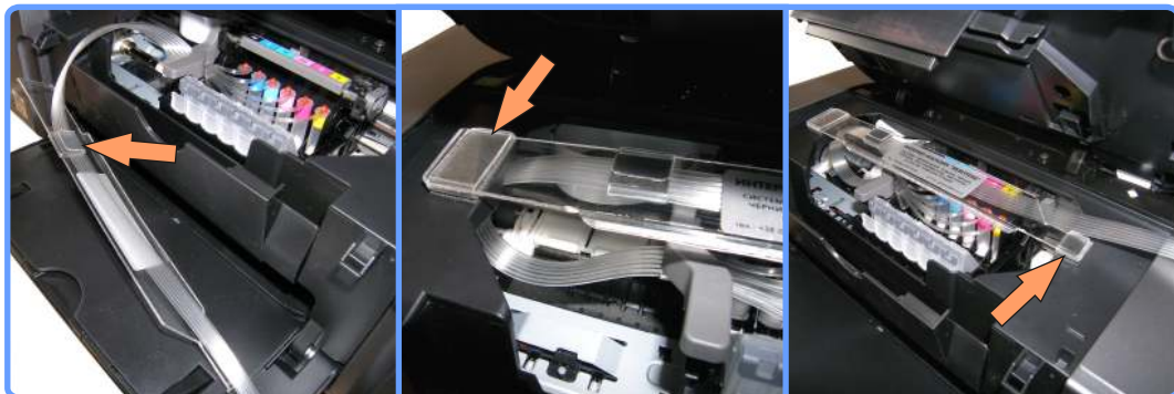
Прокладка шлейфа iP6700D

Уложите шлейф в полочку подвеса, предварительно надев по краям полочки клипсы-держатели. Установите полочку как показано на фото.