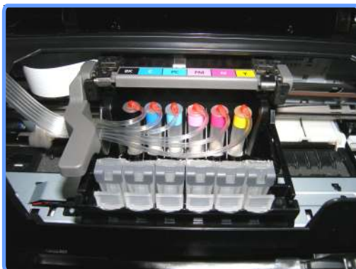
Установка картриджей iP6700D

Установите модифицированные картриджи на их штатные места в каретке.