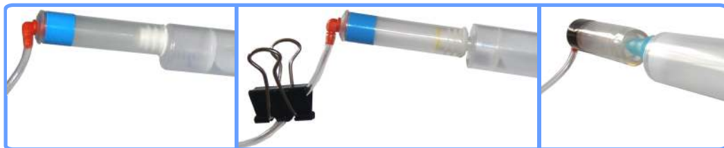
Заправка системы iP6700D

Заполните все капсулы соответствующими цветами чернил на половину, для чего наденьте по очереди капсулы на шприц и вытягивайте воздух поршнем до тех пор, пока шлейф и капсула не заполнятся чернилами. После чего пережмитесь шлейф биндером и, сняв капсулу со шприца, установите её в каретку принтера на положенное место. Для пигментной капсулы используйте переходник для шприца.