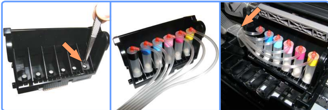
Подготовка печатающей головки iP6700D

Приклейте клипсу держатель шлейфа на левую сторону каретки, как показано на фото, и проложите в неё шлейф.