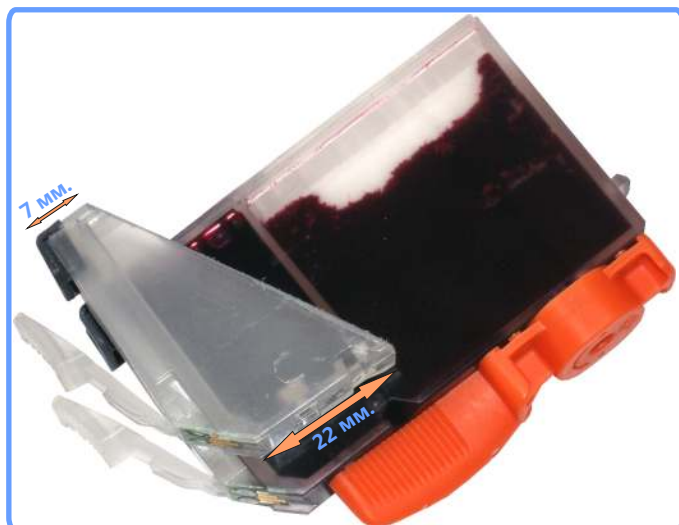
Модификация картриджей iP4200

Возьмите пустой картридж, отмойте его от оставшихся чернил. И при помощи специального инструмента, входящего в набор или ножовки, отпилите часть картриджа как показано на фотографии.