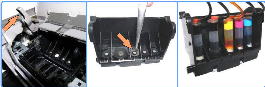
Подготовка печатающей головки iP4200

Если Вы испытываете трудности с установкой пигментной капсулы, подержите её немного в горячей воде, нижним краем. После чего она легко оденется на штуцер.