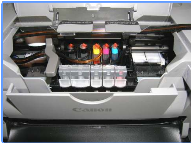
Установленная система iP4200