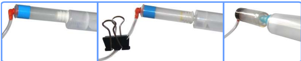
Заправка системы iP4200

Заполните все капсулы соответствующими цветами чернил на половину, для чего наденьте по очереди капсулы на шприц и оттягивайте воздух поршнем до тех пор, пока шлейф и капсула не заполнятся чернилами. После чего пережмите шлейф биндером и, сняв капсулу со шприца, установите её в каретку принтера на положенное место. Для пигментной капсулы используйте переходник для шприца.