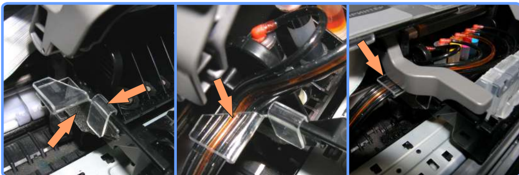
Прокладка шлейфа iP4200

К левому краю каретки приклейте клипсу, зафиксировав её специальным зажимом. Проложите шлейф, как показано на фотографии. Разделите капилляры от клипсы до капсул, это требуется для лучшей укладки шлейфа.