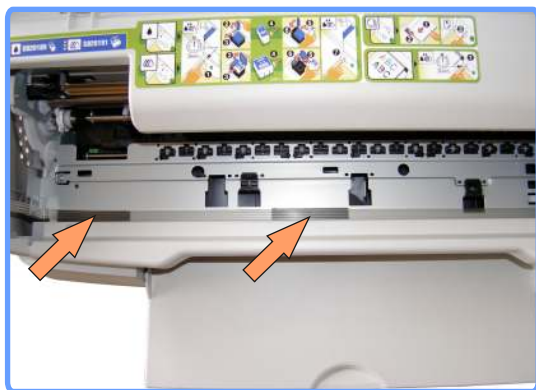
Прокладка шлейфа SC1160

Приклейте шлейф на двусторонний скотч, на середине и левее, как показано на фото. Закрепите две клипсы на левой стороне принтера. Проденьте в них шлейф, как показано на фотографии.