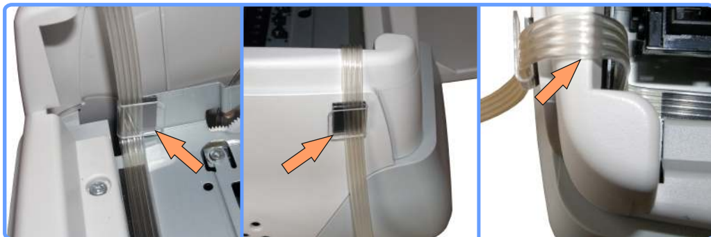
Прокладка шлейфа SC1160

Подберите длину шлейфа, уложенного через все клипсы таким образом, чтобы каретка свободно достигала своего крайнего левого и правого положений и в то же время не было сильного натяжения. Проверьте ход каретки, передвигая ее руками вправо-влево. Шлейф нигде не должен заминаться, пережиматься, цепляться, сильно натягиваться или тормозить каретку.