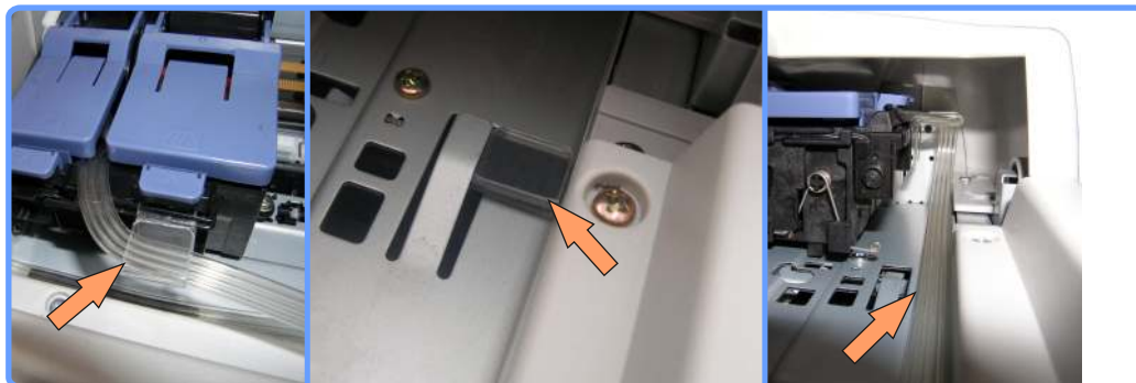
Прокладка шлейфа SC1160

Проложите шлейф под кареткой, как показано на фото. Установите клипсу на дно шасси принтера с правой стороны (в районе парковки), она служит дополнительным выступом, чтобы предотвратить возможное зацепление шлейфа за выступающую часть шасси. Шлейф должен ложиться поверх этой клипсы.