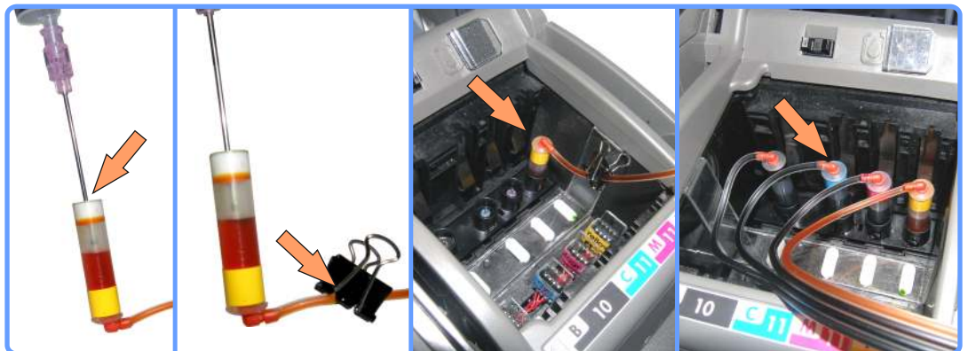
Заправка и установка капсул HP1200

Повторите процедуру заправки шлейфа и капсулы, для каждого капилляра и поместите все капсулы на штуцера принтера. Не путайте цвета! Уголки соединённые с капиллярами, должны быть направлены в сторону.