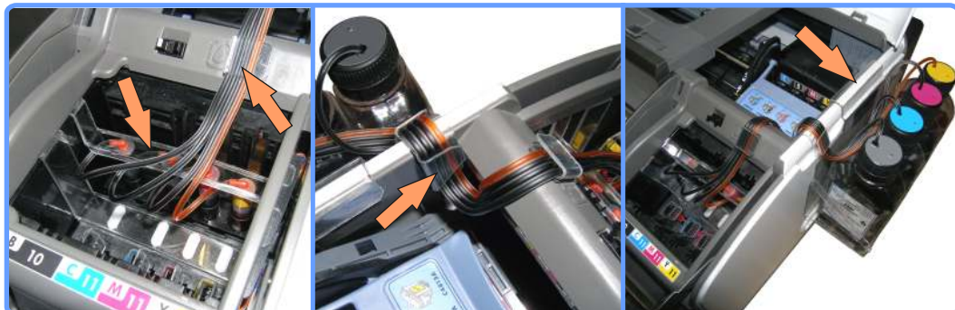
Прокладка шлейфа HP1200

Проложите шлейф через клипсы крепления. Внимательно проследите чтобы шлейф нигде не пережимался.