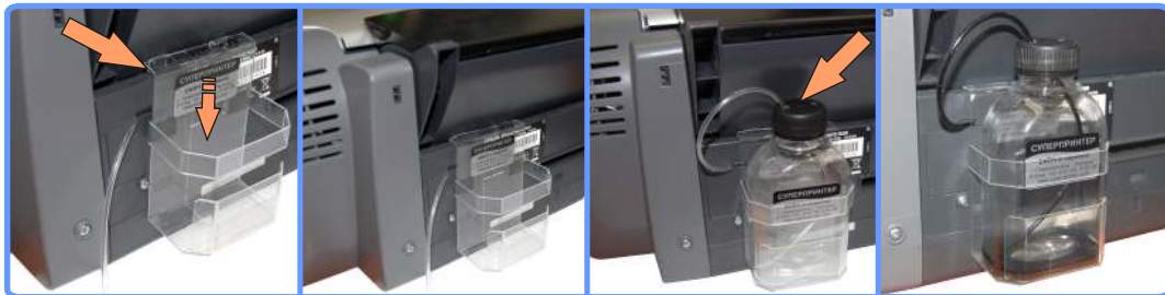
Установка держателя стока R220

Включите принтер, подождите немного, пока он сделает чистку, и убедитесь, что отработанные чернила поступают в ёмкость. Если этого не произошло, проверьте, не пережат ли капилляр. Для этого его можно просто немного вытянуть (на 1 см.) из принтера и вставить обратно, капилляр сам уложится как надо.