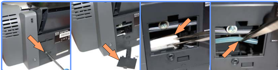
Извлечение капилляра памперса R220

Найдите крышечку сзади принтера, снимите её, открутив болт. Отсоедините капилляр, идущий от помпы в памперс.