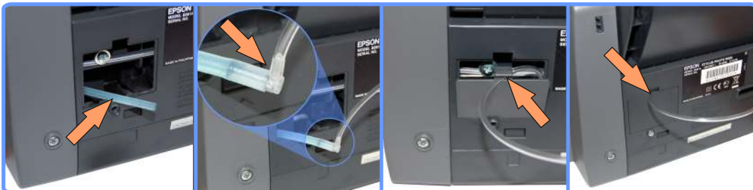
Удлинение капилляра стока R220

Выведите капилляр наружу через отверстие вверху крышки.