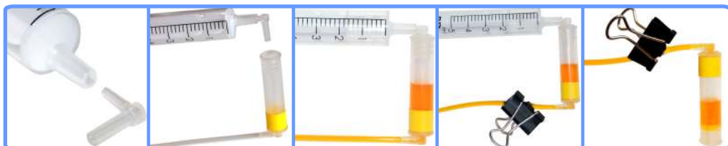
Заправка капсул и шлейфа C79

Отсоедините капсулу от шприца и наденьте её на соответствующий чернильный штуцер печатающей головки принтера. После этого можно освободить зажим.