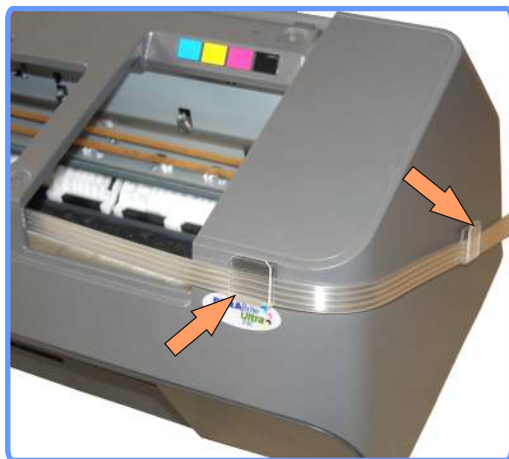
Вывод шлейфа C79

Установите две клипсы с правой стороны аппарата. И выведите через них шлейф.