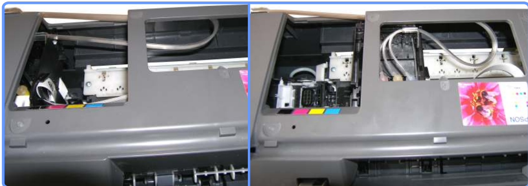
Прокладка шлейфа C79

Шлейф нигде не должен заминаться, пережиматься, цепляться, сильно натягиваться или тормозить каретку.