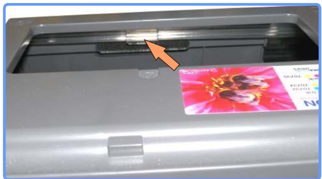
Прокладка шлейфа С79